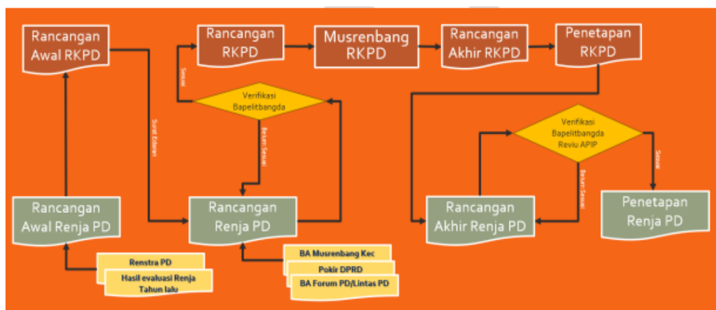
Gambar 1. 2. Tahapan Penyusunan Renja Perangkat Daerah